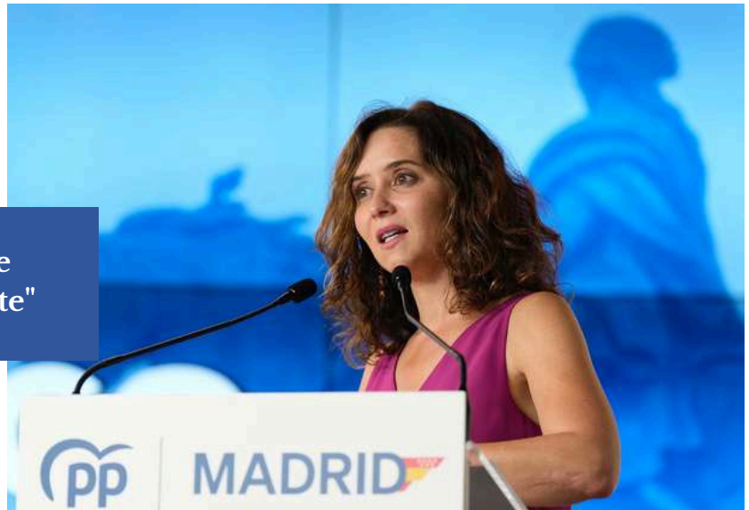
PRESIDENTA ISABEL DÍAZ AYUSO

“Vamos a plantar cara a este Gobierno, cueste lo que cueste”